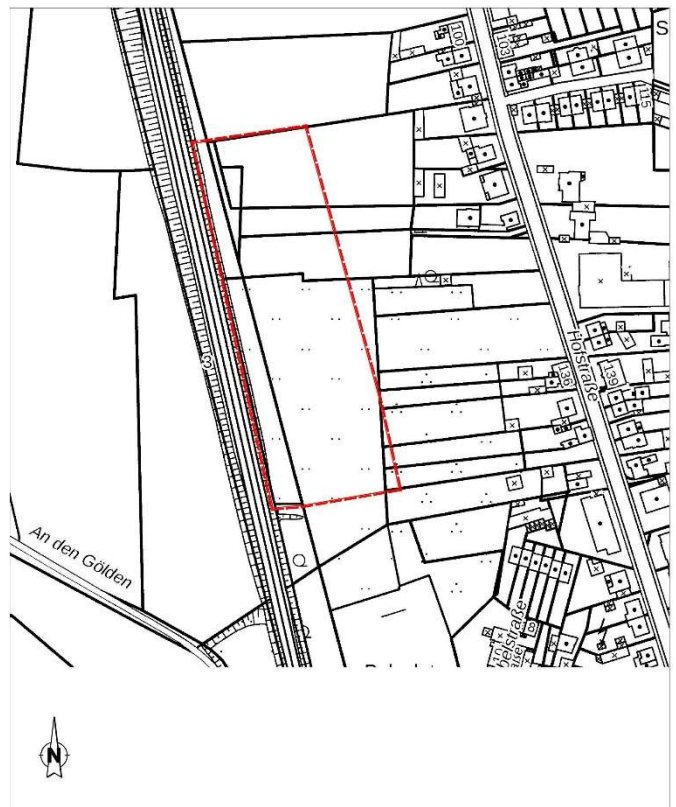
53. Flächennutzungsplanänderung - Plangebiet - (ohne Maßstab)